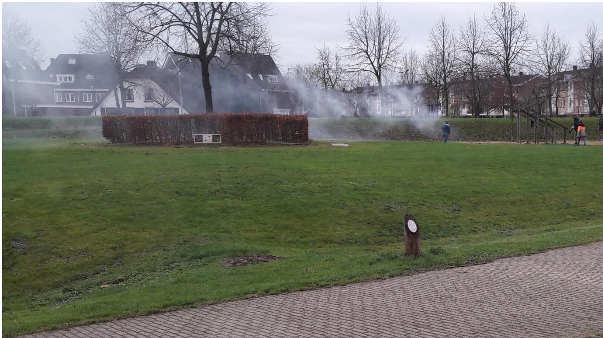
Het Kruisvaardersland, 30 december 2018 (ingezonden foto).

3 januari 2019 David Jimmink, GroenLinks Houten